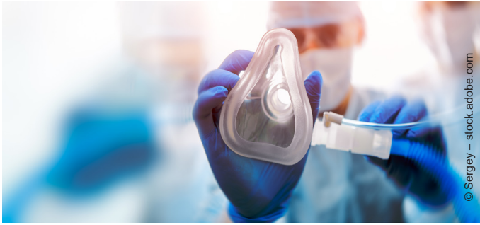
Die Gabe von Sauerstoff ist die wichtigste Behandlung.